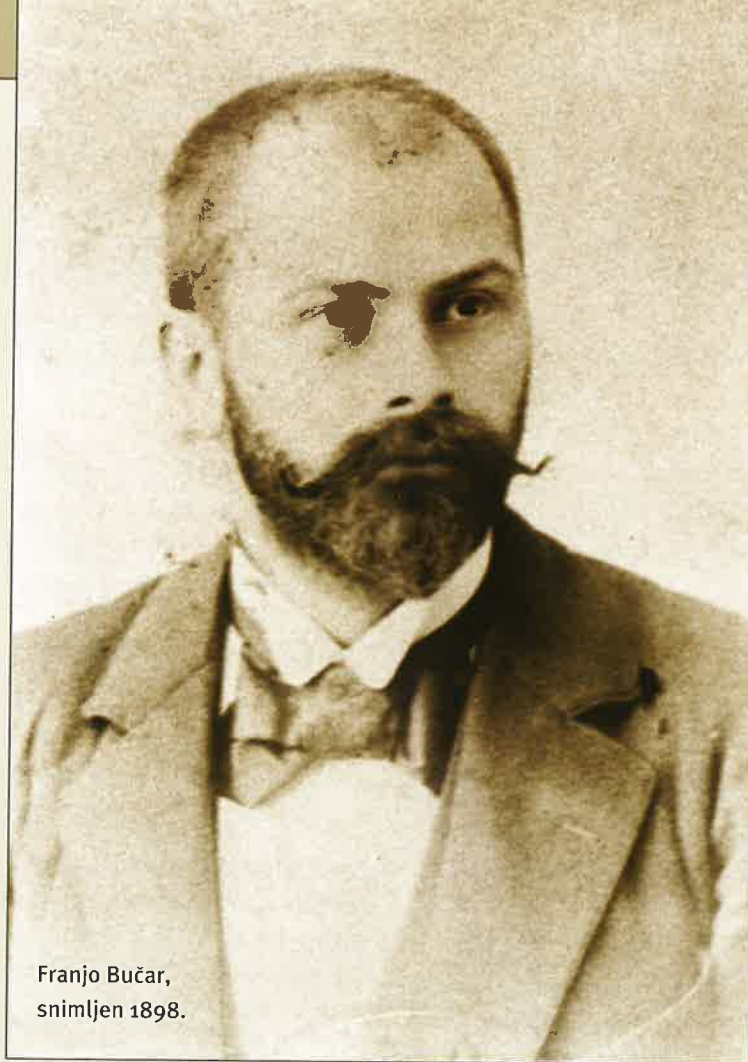
Franjo Bučar, snimljen 1898.

Nakon stvaranja Kraljevine SHS 1918. godine, Hrvatski športski savez (osnovan 5. listopada 1909.), uz organizacijske i kadrovske promjene, prenio je 14. prosinca 1919. svoje djelovanje na Jugoslavenski olimpijski odbor. Za prvoga predsjednika izabran je Franjo Bučar. Sljedeće, 1920. godine Bučar je primljen u članstvo MOO-a, a hrvatski su športaši, pod jugoslavenskom zastavom, prvi put nastupili na VII. OI u Antwerpenu 1920. godine. Međunarodno priznanje JOO-a prošlo je bez ikakvih teškoća. MOO je JOO tretirao kao nasljednika Srpskog olimpijskog kluba, osnovanog 1910. godine. Osnivanje i kasnije djelovanje JOO-a bilo je dočekano i praćeno pasivnošću i otporima jedne nehomogene i neorganizirane društvene sredine, neprirодно ujedinjene zajednice naroda. U osnovi dobri zaključci sjednica upravnog odbora JOO-a, koji su se donosili zaslugom hrvatskih delegata, mahom se nisu realizirali jer je financiranje JOO-a ovisilo o kronično mu nenaklonjenim beogradskim ministar-